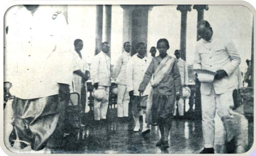
สมเด็จพระพันวัสสาฯ เสด็จฯ พระราชทานประกาศนียบัตร ณ ศิริราชพยาบาล วันที่ ๙ พฤศจิกายน พ.ศ. ๒๔๗๐

พระราชทานทุนให้นางสาวจ่านง เมืองแมน (คุณหญิงพิณพากย์พิทยาเกท) ไปศึกษาวิชา พยาบาลที่สหรัฐอเมริกา ท่านเป็นผู้อำนวยความสะดวกคนไทยคนแรกของ โรงเรียนพยาบาลผดุงครรภ์และอนามัยศิริราช (ปัจจุบัน คือ คณะพยาบาลศาสตร์ มหาวิทยาลัยมหิดล)