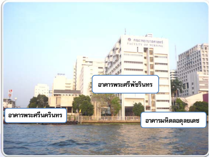
อาคารพระศรีพัชรินทร