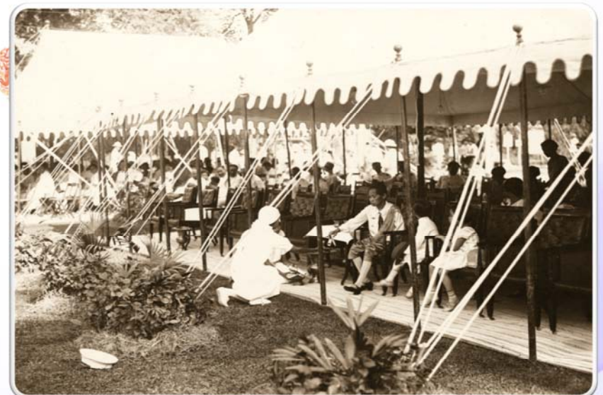
สมเด็จพระพันวัสสาอัยยิกาเจ้าพระราชทานประกาศนียบัตร แก่พยาบาลสภาภาษาไทย