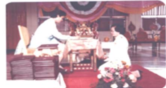
พ.ศ. ๒๕๐๖ (พ.ศ. ๒๕๐๖) สมเด็จพระนางเจ้าสิริกิติ์ พระบรมราชินีนาถ เสด็จพระราชทาน ประกาศนียบัตรพยาบาลศาสตร์ แก่ผู้สำเร็จการศึกษาจากวิทยาลัยพยาบาลตำรวจ พยาบาลศาสตร์ วิทยาลัยพยาบาลตำรวจ กรุงเทพมหานคร วันที่ ๒๗ ตุลาคม พ.ศ. ๒๕๐๖